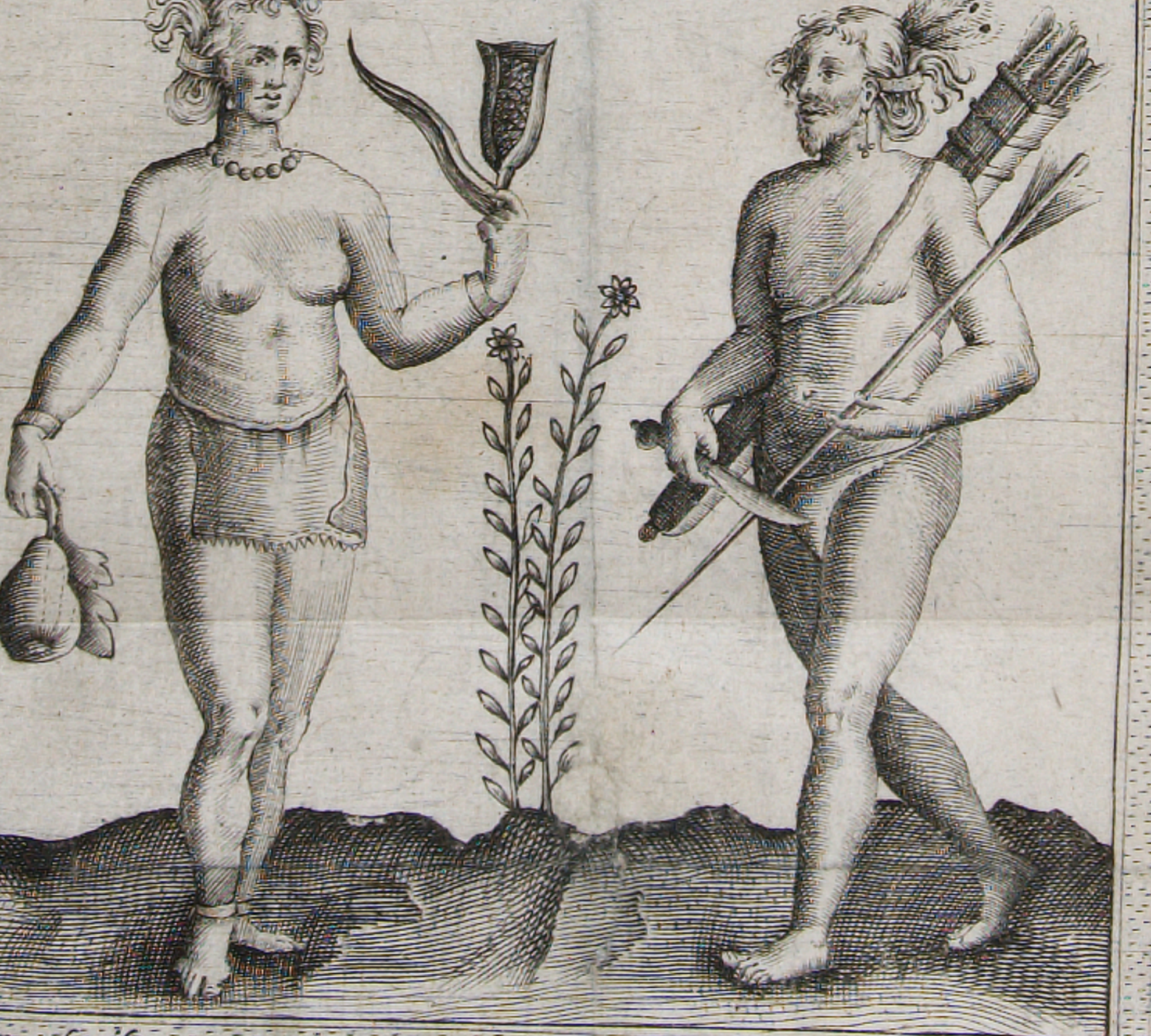
David pelletier fecit