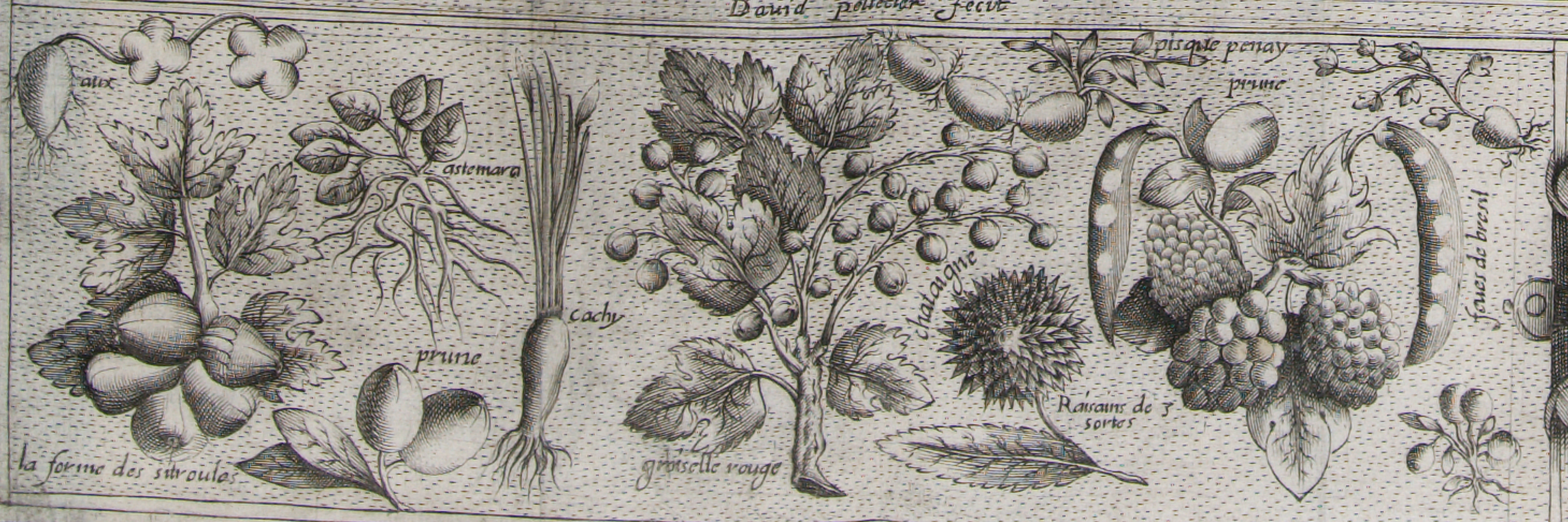
la forme des siraules