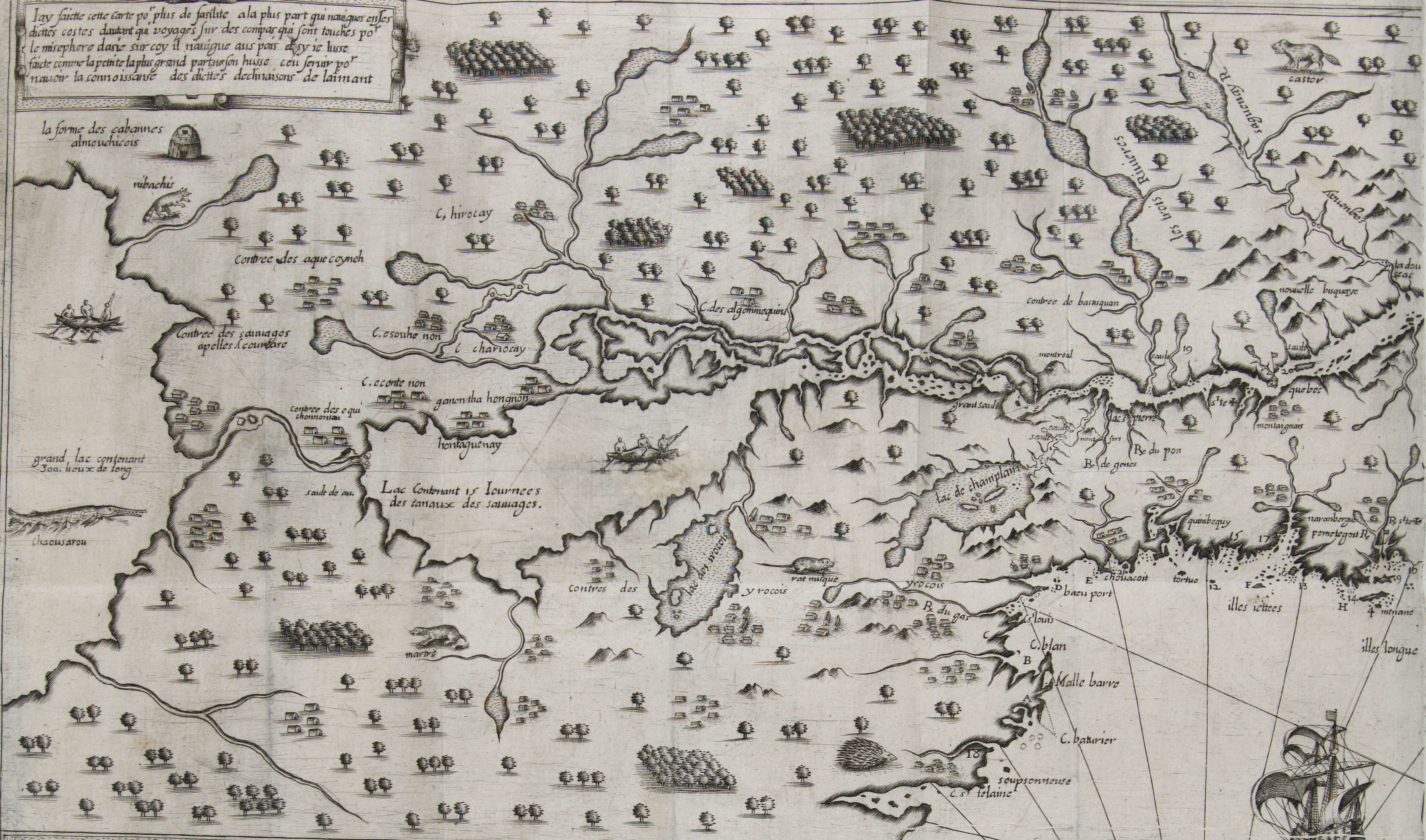
la forme des cabanes almouchicois

Jay faictte cette carte po' plus de facilité ala plus part qui navigues en ces dites costes d'autant qu'il voyages sur des compas qui sont touchés po' le misephere darie sur coy il navigue aus pais desy ie luse faictte comme la petite la plus grand parison huse ceu servir po' naivre la connoissance des dites declinaisons de l'aimant